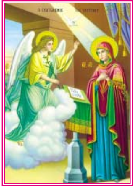
Ο ΕΥΑΓΓΕΛΙΣΜΟΣ ΤΗΣ ΘΕΟΤΟΚΟΥ

Συνάγεται λοιπόν ἐκ τῶν εἰρημένων, ὅτι, ἐπειδή καί ὁ Θεός προώρισε τήν Θεοτόκον κατά τήν προαιώνιον Αὐτοῦ εὐδοκίαν, ἧτις εἶναι, οὐχί τό ἐπόμενον καί κατ' ἐπακολούθησιν θέλημα τοῦ Θεοῦ, ἀλλά τό προηγούμενον καί κύριον Αὐτοῦ θέλημα, ὡς τό ἐρμηνεύει ὁ μέγας τῆς Θεσσαλονίκης Γρηγόριος ( Λόγος α' εἰς τὰ Φῶτα καί λόγος εἰς τήν Χριστοῦ Γέννησιν ). Συνάγεται, λέγω, ἐκ τούτων, ὅτι, καθὼς τό περιβόλι γίνεται διά νά φυτευθῆ τό δένδρον καί πάλιν τό δένδρον φυτεύεται διά τόν καρπόν, τοιοῦτοτρόπως ὅλος ὁ νοητός καί αἰσθητός κόσμος ἔγινε διά τό τέλος τοῦτο· ἦτοι διά τήν κυρίαν Θεοτόκον· καί πάλιν ἡ κυρία Θεοτόκος, ἔγινε διά τόν Κύριον ἡμῶν Ἰησοῦν Χριστόν· καί οὕτως ἐτελειώθη ἡ ἀρχαία βουλή καί ὁ σκοπός