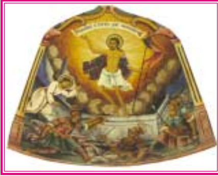
Ἡ Ἀνάστασις τοῦ Κυρίου καὶ Θεοῦ καὶ Σωτῆρος ἡμῶν Ἰησοῦ Χριστοῦ (Τοιχογραφία Μονῆς Ἁγίου Ἰωάννου τῆς Ρίλλας, Ρίλλα, Βουλγαρία).

συντελεσθήσονται ἐν χρόνῳ, καὶ ἀπὸ αὐτῶν ὁ Θεὸς οὐ κατέπαυσεν, ἀλλ' ἕως ἄρτι ἐργάζεται, κατὰ τὸ «ὁ πατήρ μου ἕως ἄρτι ἐργάζεται καὶ ἐγὼ ἐργάζομαι» (Ἰωάν. Ε' 17), ταῦτα πάντα ἄχρονα, καὶ ἀίδια καὶ ἄτρεπτα, ὅπως ἡ κρίσις καὶ ἡ ἀλήθεια καὶ τὸ ἔλεος καὶ ἡ εἰρήνη. Ταῦτα δὲ εἰσὶν τὸ μυστικόν τῆς Κυριακῆς περιεχόμενον.