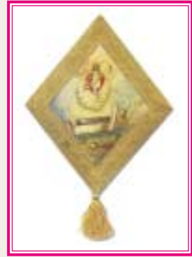
Ἡ Ἀνάστασις τοῦ Κυρίου Ἐπιγονάτιον, 1912. Μονή Σταυροβουρίου, Κύπρου «Ἡ τοῦ ΚΥΡΙΟΥ ΑΝΑΣΤΑΣΙΣ Σώματος, Ἀφθαρτισθέντος καὶ Ψυχῆς Ἐνωσις ἦν ταῦτα γὰρ τά διηρηθέντα» (Ἅγιος Ἰωάννης Δαμασκηνός Ε.Π.Ε. τόμ. 1, σελ. 566)