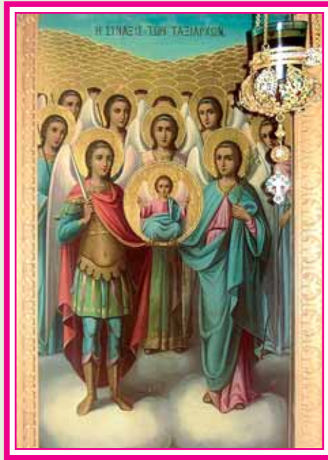
Ἡ Σύναξις τῶν Ταξιάρχων. Φορητὴ Εἰκὼν ἀγιογραφηθεῖσα εἰς τὰς ἀρχὰς τοῦ 20οῦ αἰῶνος, ἔργον Ἀγιορεϊτικῆς Τεχνοτροπίας.

πεινώσιν τῆς Κενώσεως τοῦ Δεσπότη. Ἡ ὑπερηφάνειά του δέν ἀνέχθηκε νά προσκυνήσῃ τὴν ὁμότηον τοῦ Χριστοῦ ἀνθρωπίνῃ σάρκα. Ἀρεσκόμενος περισσότερον εἰς τό κάλλος τῆς διανοίας αὐτοῦ, ὁ δοῦλος ἐναντιώθηκε εἰς τὴν μέλλουσαν ὑπὸ τοῦ Δεσπότη ἐκ τοῦ χύματος ἀνύψωσιν τῆς ἀνθρωπίνης φύσεως. Ἐφθόνησε τὴν καθ' ὑπόστασιν ἔνωσιν τῆς ἀνθρωπίνης φύσεως μετὰ τῆς Θεϊκῆς εἰς τό πρό αἰώνων ὑπάρ-