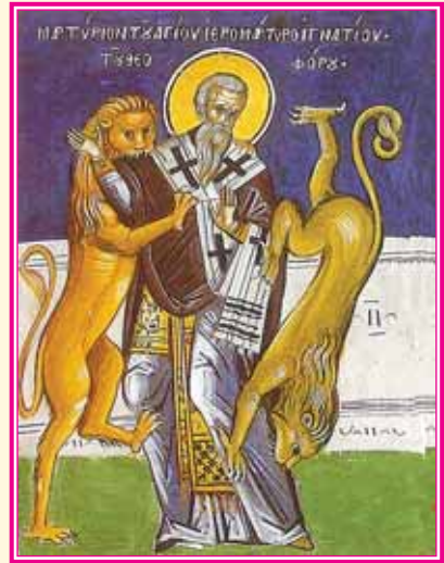
Σύγχρονος φορητὴ εἰκὼν τοῦ Μαρτυρίου τοῦ Ἁγίου Ἰγνατίου τοῦ Θεοφόρου, ὅστις ἐδόξασε τὸν Θεὸν γενόμενος βορὰ τῶν λεόντων εἰς τὴν Ῥώμην.

(7) Ἁγίου Ἰγνατίου, Πρὸς Ἐφεσίους , (P.G. 5, 644A).