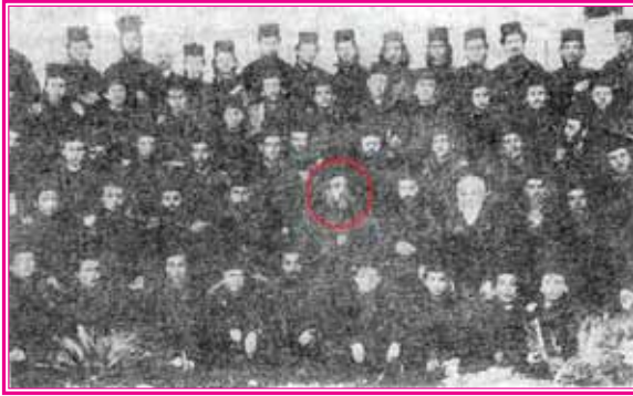
Ό Άγιος Νεκτάριος εις τήν Ριζάρειον Σχολήν, τής οποίας έχρημάτισεν Διευθυντής, έν μέσω διδασκόντων και διδασκομένων

θέσεως, αντίθεσεως, και συνθέσεως(18) του Έγγελου, προσκρούει προς τας θεμελιώδεις αρχάς(19) της Ανατολικής και Δυτικής Εκκλησίας, φθείρων τό γνήσιον και άδιάπτωτον