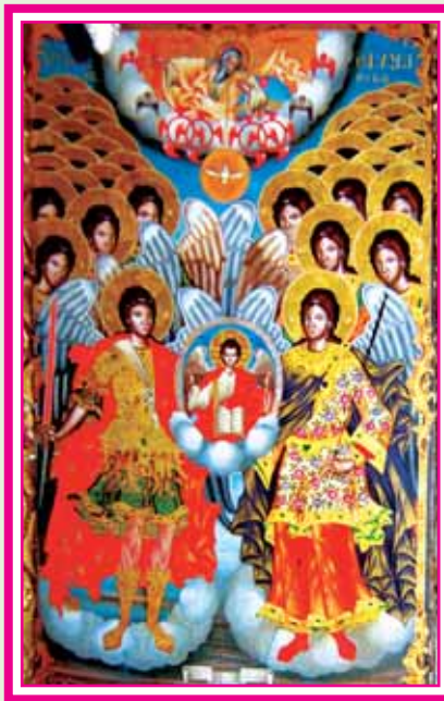
Η Σύναξις των Άσωμάτων Άγγέλων. Εικών τέμπλου τής Μονής του Μεγάλου Μετεώρου εις Θεσσαλίαν, 17ου αι. εις ην διακρίνεται άνωθεν ό Θεός Πατήρ, τό Πανάγιον Πνεϋμα και εν μέσω των Άρχαγγέλων ό Χριστός, ήτοι ή Άγια Τριάς.

Άφορμή τής Συνάξεως των Άγιων Άσωμάτων, μία αποστασία, ή ανταρσία του Έωσφόρου. Άφορμή δέ τής αποστασίας του Έωσφόρου, ό άνθρωπος, πριν άκόμη πλασθῆ. Η άγάπη του Θεού διά τον άνθρωπο, έστάθη άφορμή, πρό τής πλάσεως του ανθρώπου, να γίνη Σατανάς ό Έωσφόρος, να γίνη άντικείμενος, ό τῷ