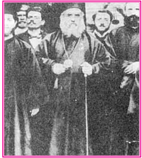
Ό Άγιος Νεκτάριος εις τήν Κύμην Εύβοίας τό 1890.

(18) Διά νά γίνη πιό αντιληπτό τό βασικόν Έγγελιανόν σχήμα Θέσις - Αντίθεσις - Σύνθεσις ίσως βοηθήση τό κατωτέρω συγκεκριμένο παράδειγμα :