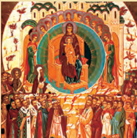
Η ΣΥΝΑΞΙΣ ΤΗΣ ΥΠΕΡΑΓΙΑΣ ΘΕΟΤΟΚΟΥ