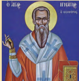
Ίγνατίου Θεοφώρου ιερομάρτ. & Φιλογονίου όσιου επίσκόπων Άντιοχείας