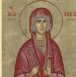
Εϋστρατίου, Αϋξεντίου, Εϋγενίου, Μαρδαρίου, Ορέστου & Λουκίας μαρτύρων