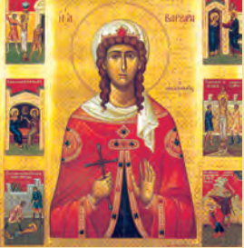
Βαρβάρας μεγαλομάρτυρος Ίωάννου Δαμασκηνού όσιου Ίουλιανής μάρτυρος