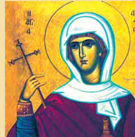
Άναστασίας Φαρμακολυτριάς μεγαλομάρτυρος, Χρυσογόνου μάρτυρος