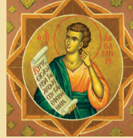
Άββακούμ προφήτου Κυρίλλου όσιου Μυρώπης μάρτυρος