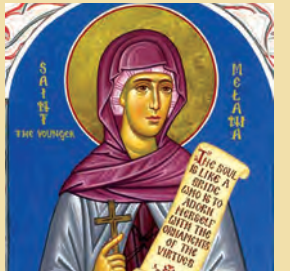
Άπόδοσις Χριστουγέννων Μελάνης όσιας Ρωμαίας Ζωτικού μάρτυρος

«Ταϋτα δέ πάντα τών άντιλεγόμενων άν είη, άναγκαιώς δέ και τούτων όμως τόν κατάλογον πεποιήμεθα, διακρίνοντας τας τε κατά την Έκκλησιαστικήν παράδοσιν άληθείς και άπλάστους άνωμολογημένας γραφάς και τας άλλας παρά ταϋτας, οϋκ ένδιαθήκους μέν αλλά και άντιλεγόμενας, όμως δέ παρά πλείστοις τών Έκκλησιαστικών γνωσκομένας... έν οϋδέν οϋδαμώς έν συγγράμματι τών κατά τας ΔΙΑΔΟΧΑΣ έκκλησιαστικών τις άνηρ είς μνήμην άγαγείν ήξίωσεν, πόρρω δέ που και ό τής φράσεως παρά τό ήθος τό ΑΠΟΣΤΟΛΙΚΟΝ έναλλάττει χαρακτήρ, ή τε γνώμη και ή τών έν αυτοίς φερομένων προαιρέσις πλείστον όσον τής άληθοϋς Όρθοδοξίας άπάδουσα, ότι δή αίρετικών άνδρών άναπλάσματα τυγχάνει σαφώς παρίστησιν όθεν οϋδ' έν νόθοις αυτά κατατακτέον, άλλ' ως άτοπα πάντη και δυσσεβή παραιτητέον.» (Εϋσέβιος Καισαρείας, 4ος αϊ., Ε.Π.Ε. 1, σελ. 312-314). ΜΕΤΑΦΡΑΣΙΣ: Όλα αυτά άνήκουν είς τὰ άμφισβητούμενα, αλλά έδωρήσαμεν άναγκαιόν να καταρτίσωμεν και τόν κατάλογον τούτων, διακρίνοντας τὰ συμφώνως πρὸς τήν Έκκλησιαστικήν παράδοσιν άληθή, γνήσια και παραδεγεμένα συγγράμματα από τὰ άλλα τὰ όποια άντιθέτως δέν είναι κανονικά αλλά άμφισβητούνται, άν και είναι γνωστά είς τούς περισσότερους Έκκλησιαστικούς... έκ τών όποιων κειμένων κανένα δέν ήξίωσε να μνημονεύση ποτέ κανείς Όρθόδοξος κατά τας ΔΙΑΔΟΧΑΣ άνηρ, καθώς και ό χαρακτήρ τής εκφράσεως αυτών παραλλάσει πάρα πολυ άπό τό ΑΠΟΣΤΟΛΙΚΟΝ ήθος και τό περιεχόμενό των άπέχει πολυ άπό την άληθή Όρθοδοξίαν ως πλάσματα αίρετικών άνδρών.