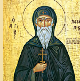
Σωσθένους, Άπολλώ, Κηφά, Τυχικού, κ.λπ. Αποστόλων, Παταπίου όσιου