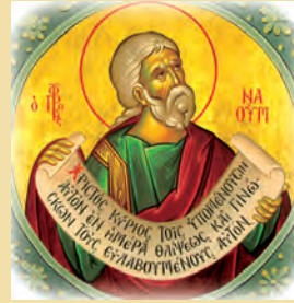
Ναοΐμ προφήτου Φιλάρετου όσιου Ανανίου μάρτυρος τοϋ Πέρσου