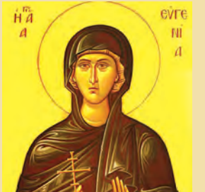
Παραμονή Χριστουγέννων Εϋγενίας, Βασιλλας, Φιλίππου & Πρωτά μαρτύρων