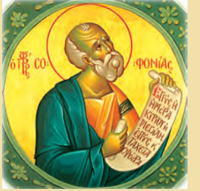
Σοφονίου προφήτου Θεοδώρου Αλεξανδρείας ιερομ. Άγγελή νεομάρτυρος