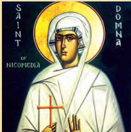
Τών έν Νικομηδεία δισμυρίων μαρτύρων, Δόμνης μάρτυρος