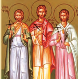
Θύρσου, Λευκίου, Καλλινίκου, Φιλήμονος & λοιπών μαρτύρων