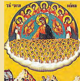
Τών υπό Ηρώδου 14.000 άναιρεθέντων Νηπίων, Μαρκέλλου όσιου