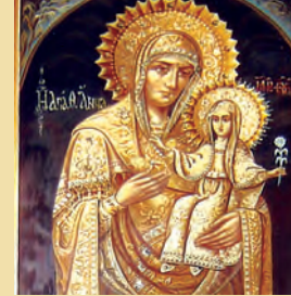
Σύλληψις Αγίας Άνης Μητρός τής Θεοτόκου