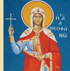
Άγγαίου προφήτου Μοδέστου Ίερομάρτυρος Θεοφάνους βασιλ., Μαρίνου μ.