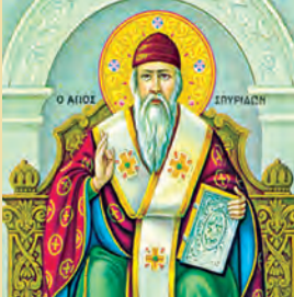
Σπυρίδωνος Τριμυθούντος τοϋ Θαυματουργού