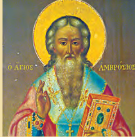
Άμβροσίου επίσκ. Μεδιολάνων Γρηγορίου ήσυχαστοϋ