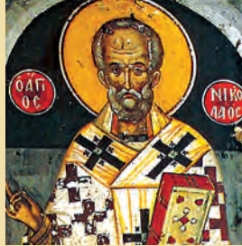
Νικολάου επισκόπου Μύρων τοϋ Θαυματουργού