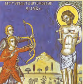
Μοδέστου Ίεροσολύμων Σεβαστιανού, Ζωής, Εϋβίουτοϋ & Ζαχαρίου μ., Φλώρου όσιου