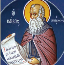
Σάββα όσιου τοϋ ήγιασμένου Διονύσιου & Άβερκίου μαρτύρων