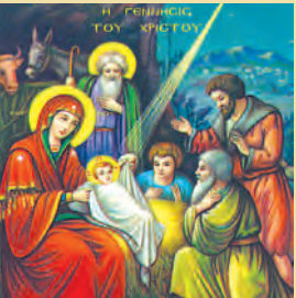
Η ΚΑΤΑ ΣΑΡΚΑ ΓΕΝΝΗΣΙΣ ΤΟΥ ΚΥΡΙΟΥ ΗΜΩΝ ΙΗΣΟΥ ΧΡΙΣΤΟΥ