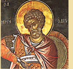
Μηνά τοϋ Καλλικελάδου Έρμιογόνου & Εϋγράφου μαρτ. Θωμά Δεφουρκινού όσιου