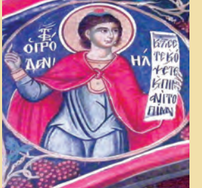
Δανιήλ προφήτου & τών 3 παιδών έν Καμίνω, Διονυσίου Αίγινης έν Ζακύνθου