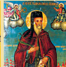
Άνυσίας μάρτυρος Θεοδόρας όσιας Γεδεών νεομάρτ. έν Τυρνάβη