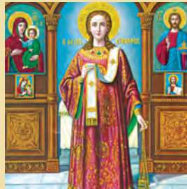
Στεφάνου τοϋ αρχidiaκόνου & πρωτομάρτυρος