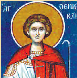
Ίουλιανής & σόν αυτή 500 μαρτύρων, Θεμιστοκλέους μάρτυρος