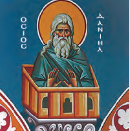
Δανιήλ όσιου Στυλίου Λεοντίου όσιου Άειθαλά μάρτυρος