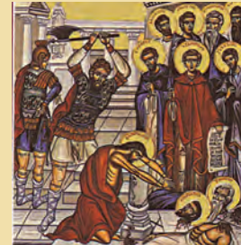
Τών έν Κρήτη 10 μαρτύρων Παύλου Νεοκαισαρείας Ναοΐμ όσιου θαυματουργού