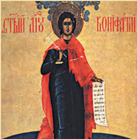
Βονιφατίου μάρτυρος Γρηγγελίου Αιθιοπίας Εϋτυχίου & σόν αυτώ 270 μαρτ.