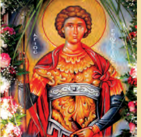
Γεωργίου μεγαλομάρτυρος τοῦ Τροπαιοφόρου