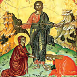
Τῶν ΜΥΡΟΦΟΡῶΝ Συμεὼν ἱερομ. & τῶν σὺν αὐτῷ Ἀγαπητοῦ πάπα Ρώμης