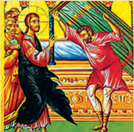
ΤΟΥ ΠΑΡΑΛΥΤΟΥ Ἐλισάβετ ὁσίας Σάββα & σὺν αὐτῷ 70 μαρτύρων