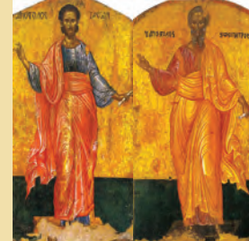
Ἰάσωνος & Σωσιπάτρου τῶν Ἀποστόλων Κερκύρας μάρτυρος