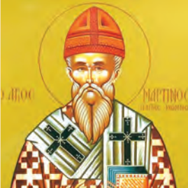
Μαρτίνου πάπα Ρώμης τοῦ ὁμολογητοῦ & τῶν σὺν αὐτῷ μαρτύρων