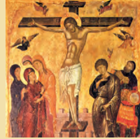
Τὰ Ἅγια Πάθη & ἡ Σταύρωσις τοῦ Κυρίου ἡμῶν Ἰησοῦ Χριστοῦ Μαρίας ὁσίας Αἰγυπτίας