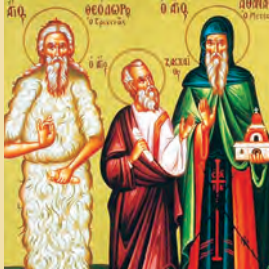
Ζαχαρίου Ἀποστόλου Ἀναστασίου ἱερομάρτυρος Θεοδώρου ὁσίου Τριχινᾶ