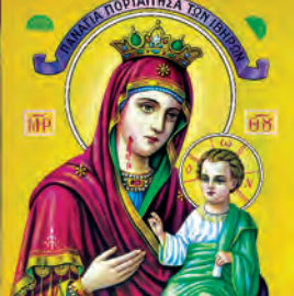
Παναγίας Πορταΐτισσης Κλαυδίου, Διοδώρου, Παππίου & τῶν σὺν αὐτοῖς μαρτύρων