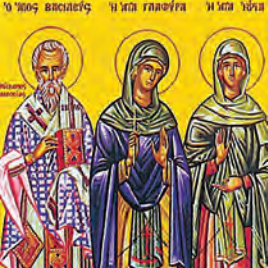
Βασιλέως ἱερομάρτυρος ἐπισκόπου Ἀμασειας, Γλαφύρας ὁσίας