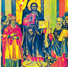
ΜΕΣΟΠΕΝΤΗΣΚΟΤΗΣ Συμεὼν Ἱεροσολύμων ἱερομάρτ. Ἰωάννου ὁσίου Ὁμολογητοῦ