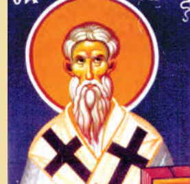
Λεωνίδου ἐπισκ. Ἀθηνῶν ἱερομ. Κρήσκεντος μάρτυρος