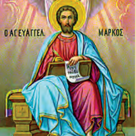
Μάρκου Ἀποστ. & Εὐαγγελιστοῦ Μακεδονίου πατρ. Κων/πόλεως Νίκης μάρτυρος