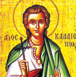
Καλλιπίου μάρτυρος Γεωργίου ἐπισκόπου ὁσίου