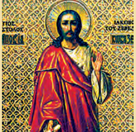
Ἰακώβου Ἀποστ. υἱοῦ Ζεβεδαίου Ἀργυρῆς νεομάρτυρος

Πληρωθέντες Πνεύματος Ἁγίου οἱ Ἀπόστολοι ἀπεστάλησαν εἰς τὰ πέρατα τῆς γῆς διὰ νὰ παραδώσουν ὅσα παρέλαβον.