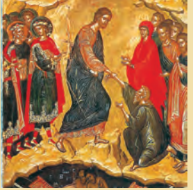
Ἡ Ταφή & ἡ εἰς Ἄδου Κάθοδος τοῦ Κ.Η.Ι.Χ. Τίτου ὁσίου θαυματούργου