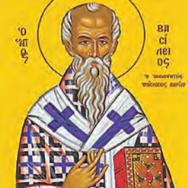
Βασιλείου ἐπισκ. ὁμολογητοῦ Ἀκακίου ὁσίου Ἀνθούσης μαρτύρος