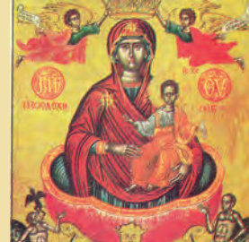
ΖΩΟΔΟΧΟΥ ΠΗΓΗΣ Ἡρωδῖανος, Ἀγάβου, Ρούφου, Ἀσυγκρίτου, Ἐρμού Ἀποστόλων