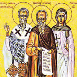
Εὐθυχίου πατρ. Κων/πόλεως τῶν ἐν Περισίδι 120 μαρτύρων