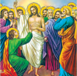
ΨΗΛΑΦΗΣΙΣ ΘΩΜΑ Τερεντίου, Μιλτιάδου μαρτύρων Γρηγορίου Ε' Κων/πόλεως