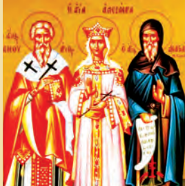
Ἀναστασίου ὁσίου Σιναιτοῦ Ἰανουαρίου μάρτυρος Ἀλεξάνδρας βασιλίσσης μάρτ.