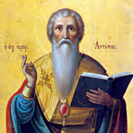
Ἀντίπα ἐπισκόπου Περγάμου Φαρμουθίου ὁσίου Τρυφαινῆς ὁσίας