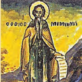
Τῶν ἐν Κυζίκῳ 9 μαρτύρων Μέμνονος ὁσίου θαυματούργου Βαλερίας μάρτυρος