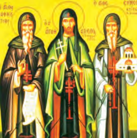
Παφνουτίου ἱερομ., Συμεὼν ὁσ. Ἀγαθαγγέλου ὁσίου Φιλοθέτου