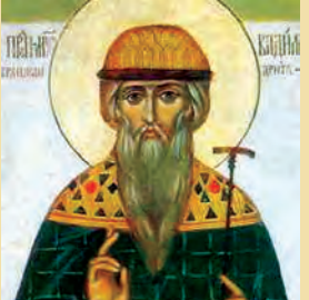
Εὐθυχίου μάρτυρος Βαδίμου & τῶν σὺν αὐτῷ ὁσίων