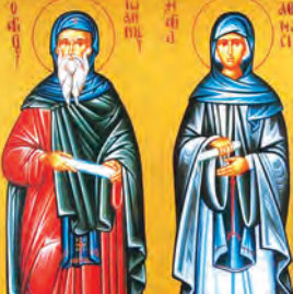
Ἰωάννου ὁσίου τοῦ Δεκαπολίτου Ἐλισάβετ ὁσ., Εὐσεβίου μάρτ. Σάββα & σὺν αὐτῷ 70 μαρτύρων