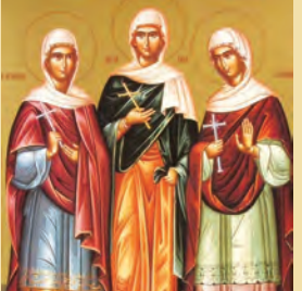
Ἀγάθης, Χιονίας, Εἰρήνης & Γαλήνης τῶν μαρτύρων