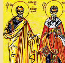
Ναθαναὴλ Ἀποστόλου Θεοδώρου ὁσίου τοῦ Συκεώτου