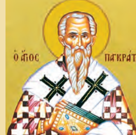
Παγκρατίου Ταυρομενίας ἱερομ. Ἀνδρέου & Πρόβου μαρτύρων Διονυσίου ὁσίου