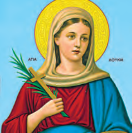
Ἀνδρέου Κρήτης Κυπρίλλης & Λουκίας μαρτύρων Θεοφίλου ἱερομάρτυρος