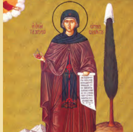
Προχόρου, Νικάνορος, Τιμωνος, Παρμενῆ Ἀποστόλων ἐκ τῶν 70, Εἰρήνης Χρυσοβαλάντου