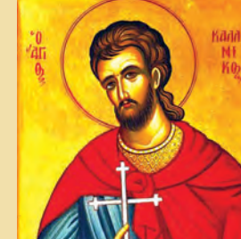
Καλλινίκου & Θεοδότῆς μαρτ. Βασιλίσκου μάρτυρος