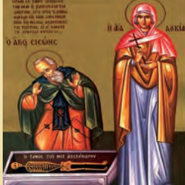
Ἀρχίππου κ.λπ. Ἀποστόλων, Λουκίας & Ρήζου μαρτύρων, Σισῶη ὁσίου