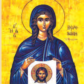
Πρόκλου & Ἰαυρίου μαρτύρων Βερονικῆς αἰμορροούσης μάρτ.