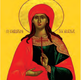
Χριστίνης μεγαλομάρτυρος Ἀθανασίου μάρτυρος