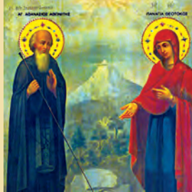
Ἀθανασίου ὁσίου τοῦ Ἀθωνίτου, Λαμπαδοῦ ὁσίου τοῦ θαυματουργοῦ