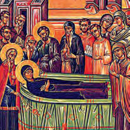
Κοῖμησις ἁγίας Ἄννης Θεοπρομήτορος