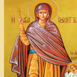
Κηρκῶ & Ἰουλίττης μαρτύρων Βλαδμήρου ἰσαποστόλου