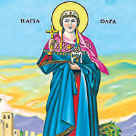
Εὐφημίας μεγαλομάρτυρος Ὀλγας ἰσαποστ., Λέοντος ὁσίου, Μαρκανοῦ μάρτυρος