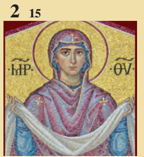
2 15 Κατάθεσις Τιμίας Ἐσθήτος Θεοτόκου ἐν Βλαχέρναις