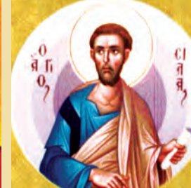
Σίλα, Σιλουανῶ, Κρήσκεντος κ.λπ. Ἀποστόλων