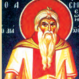
Συμεῶν ὁσίου Ἰωάννου ὁσίου Παρθενίου ἐπισκόπου Ἄρτης