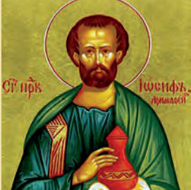
Ἰωσήφ τοῦ ἀπὸ Ἀρμαθαίας Εὐδοκίμου δικαίου

«Τῶν ἐπὶ Ῥώμῃς ἐπισκοπευσάντων Κατάλογος. Θεμελιώσαντες οὖν καὶ οἰκοδομήσαντες οἱ μακάριοι Ἀπόστολοι τὴν Ἐκκλησίαν, Λίνῳ τὴν τῆς Ἐπισκοπῆς λειτουργίαν ἐνεχείρισαν.... Μετὰ τοῦτον δὲ τρίτῳ τόπῳ ἀπὸ τῶν Ἀποστόλων τὴν Ἐπισκοπὴν κληροῦται Κλήμης, ὁ καὶ ἐωρακῶς τοὺς μακαρίους Ἀποστόλους καὶ συμβεβληκῶς αὐτοῖς καὶ ἔτι ἔναυλον τὸ κήρυγμα τῶν Ἀποστόλων καὶ τὴν Παράδοσιν ἔχων οὐ μόνος ἔτι γὰρ πολλοὶ ὑπελείποντο τότε ὑπὸ τῶν ΑΠΟΣΤΟΛΩΝ δεδιδαγμένοι.... Τὸν δὲ Κλήμεντα τοῦτον ΔΙΑΔΕΧΕΤΑΙ Εὐάρεστος... ΔΙΑΔΕΞΑΜΕΝΟΥ τὸν Ἀνίκητον Σωτήρος, νῦν δωδεκάτῳ τόπῳ τὸν τῆς ἐπισκοπῆς ἀπὸ τῶν Ἀποστόλων κατέχει κληρὸν Ἐλευθερος. Τῇ αὐτῇ τάξει καὶ τῇ αὐτῇ διδαχῇ ἣ τε ἀπὸ τῶν Ἀποστόλων ἐν τῇ Ἐκκλησίᾳ Παράδοσις τὸ τῆς Ἀληθείας κήρυγμα κατήντηκεν εἰς ἡμᾶς.» (Εὐσέβιος Καισαρείας, 4ος αἰ. Ἐκκλησιαστικὴ Ἱστορία, Ρ.Γ. 20, 445A-C).