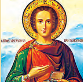
Παντελεήμονος μεγαλομάρτυρος Ἀνθούσης μάρτυρος