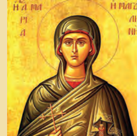
Μαρίας Μαγδαλινῆς ἰσαποστόλου Μαρκέλλης παρθενομάρτυρος