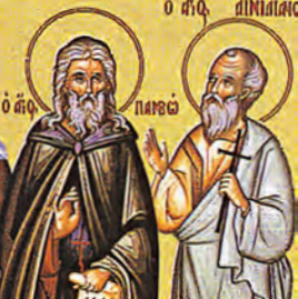
Αἰμιλιανῶ μάρτυρος Παύλου & Παμβῶ τῶν ὁσίων