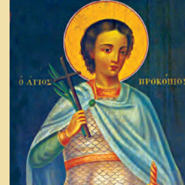
Προκοπίου & Θεοδοσίας μαρτ. Αναστασίου ἱερομάρτυρος Θεοφίλου Ἀθωνίτου