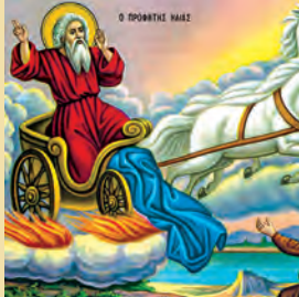
Ἥλιου προφήτου τοῦ Θεοσβίτου ἢ πυρφόρος εἰς οὐρανοῦς ἀνάβασις