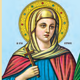
Θωμά ὁσίου τοῦ ἐν Μαλεῶ Κυριακῆς μεγαλομάρτυρος