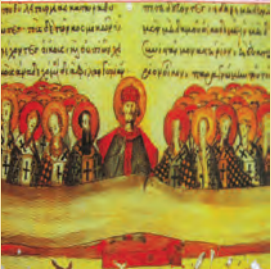
Δ' Οἰκουμενικῆς Συνόδου Μαρίνης μεγαλομ., Βηρονικῆς & Σπεράτου τῶν μαρτύρων