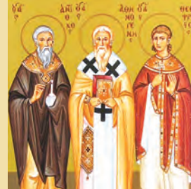
Ἀθηνόγονος ἱερομάρτυρος, Φαύστου & σὺν αὐτῷ 15.000 μαρτύρων