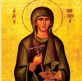
Παρασκευῆς ὁσιομάρτυρος Ἐρμολάου ἱερομάρτυρος