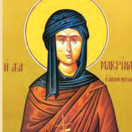
Μακρινῆς & Δίου ὁσίων, Ἀνακομιδῆ λειψάνων ὁσίου Σεραφεῖμ ἐν Σαρῶφ