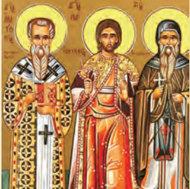
Ἀνατολίου Κων/πόλεως Υακίνθου & Θεοδότου μαρτύρων Γερασίου ὁσίου