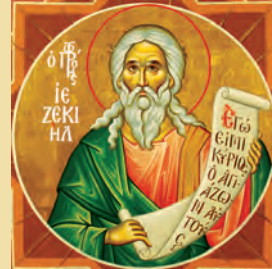
Ἰεζεκιὴλ προφήτου Φωκά ἱερομάρτυρος Πελαγίας ὁσίας ἐν Τήνῳ