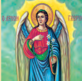
Συναξίς Ἀρχαγγέλου Γαβριὴλ Στεφάνου ὁσίου