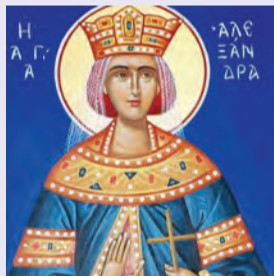
Ἀλεξάνδρας βασιλίσσης μάρτ. Ἀναστασίου ὁσίου Σιναΐτου Ἰανουαρίου μάρτυρος