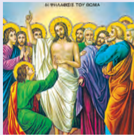
ΨΗΛΑΦΗΣΙΣ ΘΩΜΑ Τίτου ὁσίου θαυματουργοῦ Πολυκάρπου & Ἀμφιανού μαρτ.