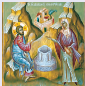
ΤΗΣ ΣΑΜΑΡΕΪΤΙΔΟΣ Γεωργίου μεγαλομάρτυρος τοῦ Τροπαιοφόρου