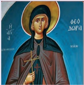
Θεοδώρας τῆς ἐν Θεσσαλονίκη Κλαυδίου, Διοδώρου, Παππίου & τῶν σὺν αὐτοῖς μαρτύρων