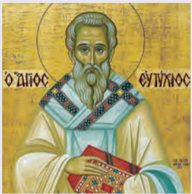
Εὐθυμίου πατρ. Κων/πόλεως τῶν ἐν Περσίδι 120 μαρτύρων