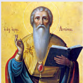
Ἀντίπα ἐπισκόπου Περγάμου Φαρμουθίου ὁσίου Τρυφαινῆς ὁσίας