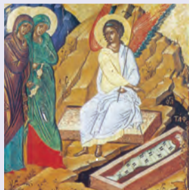
Τῶν ΜΥΡΟΦΟΡῶΝ Εὐθυμίου μάρτυρος Βαδίου & τῶν σὺν αὐτῷ ὁσίων