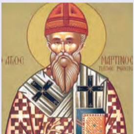
Μαρτίνου πάπα Ρώμης τοῦ ὁμολογητοῦ & τῶν σὺν αὐτῷ μαρτύρων