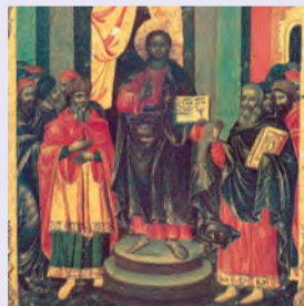
ΜΕΣΟΠΕΝΤΗΚΟΣΤΗΣ Παφνουτίου ἱερομ., Συμεὼν ὁσ. Ἀγαθαγγέλου ὁσίου, Ἐσφιγμέντου