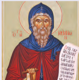
Τῶν ἐν Κυζίκῳ 9 μαρτύρων Μέμνονος ὁσίου θαυματουργοῦ