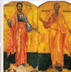
Ἰάσωνος & Σωσιπάτρου τῶν Ἀποστόλων ἐκ τῶν 70, Κερκύρας μάρτυρος