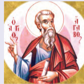
Ἡρωδίωνος, Ἀγάβου, Ρούφου, Ἀσγκρίτου, Φλέγοντος, Ἑρμού Ἀποστόλων ἐκ τῶν 70