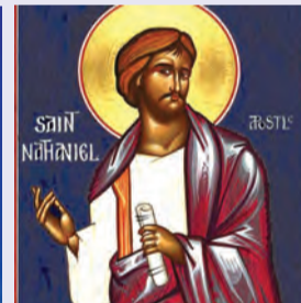
Ναθαναὴλ Ἀποστόλου Θεοδώρου ὁσίου τοῦ Συκεώτου