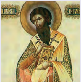
Γεωργίου ἐπισκόπου ὁσίου Καλλιστίου μάρτυρος