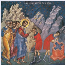
ΤΟΥ ΤΥΦΛΟΥ Ἰακώβου Ἀποστ. υἱοῦ Ζεβεδαίου Ἀργυρῆς νεομάρτυρος

«Οὐδὲν παροξύνει τὸν Θεόν, ὡς τὸ Ἐκκλησίαν ΔΙΑΙΡΕΘΗΝΑΙ»