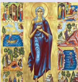
Μαρίας ὁσίας Αἰγυπτίας Μακαρίου ὁσίου ὁμολογητοῦ