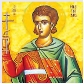
Τερεντίου, Πομπηίου κ.λπ. μαρτ. Μιλτιάδου ἱερομάρτυρος Γρηγορίου Ε' Κων/πόλεως