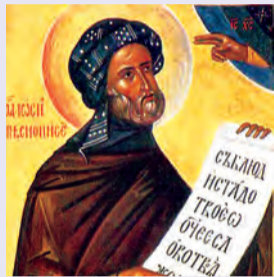
Νικήτα ὁσίου Μονῆς Μηδικίου Ἰωσήφ ὁσίου τοῦ Ὑμνογράφου