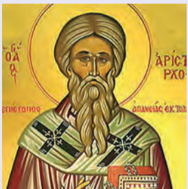
Ἀριστάρχου, Πούδη & Τροφίμου ἐκ τῶν 70 Ἀποστόλων