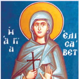
Ἐλισάβετ ὁσίας Θαυματουργοῦ Σάββα & σὺν αὐτῷ 70 μαρτύρων Εὐσεβίου μάρτυρος