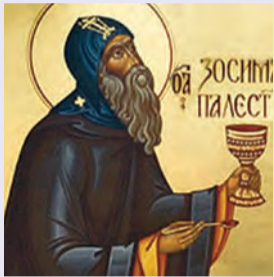
Ζωσιμᾶ ὁσίου Γεωργίου ὁσίου τοῦ ἐν Μαλεῷ