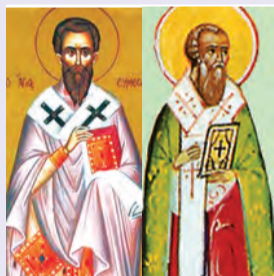
Συμεὼν ἱερομάρτυρος & τῶν σὺν αὐτῷ μαρτύρων Ἀγαπητοῦ πάπα Ρώμης