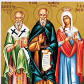
Βασιλείου ἐπισκ. ὁμολογητοῦ Ἀκακίου Κασσαλοβιτίτου ὁσίου Ἀνθούσης μάρτυρος