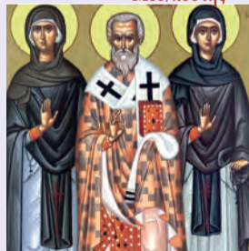
Βασιλέως ἱερομάρτυρος ἐπισκόπου Ἀμασειᾶς, Γλαφύρας ὁσίας