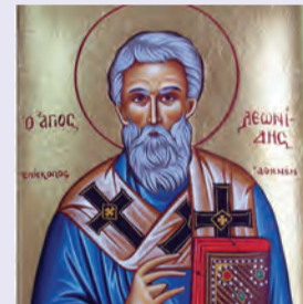
Λεωνίδου ἐπισκ. Ἀθηνῶν ἱερομ. Κρήσκεντος μάρτυρος