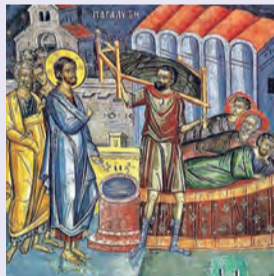
ΤΟΥ ΠΑΡΑΛΥΤΟΥ Ἀγάπης, Χιονίας, Εἰρήνης & Γαληνῆς τῶν μαρτύρων