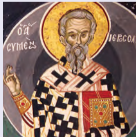
Συμεὼν Ἱεροσολύμων ἱερομάρτ. συγγενοῦς τοῦ Κυρίου, Ἰωάννου ὁσίου Ὁμολογητοῦ