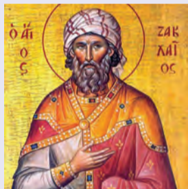
Ζαχαρίου Ἀποστόλου Ἀναστασίου Ἀντιοχείας ἱερομ. Θεοδώρου ὁσίου τοῦ Τριχινά