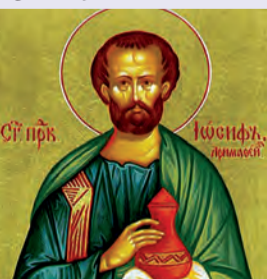
Ἰωσήφ τοῦ ἀπὸ Ἀρμαθαίας Εὐδοκίμου δικαίου

« Ἐπόμενοι τοῖς Ἁγίοις Πατέρασιν... οὓς μὲν τῷ ΑΝΑΘΕΜΑΤΙ παραπέμπουσι, καὶ ἡμεῖς ἀναθεματίζομεν οὓς δὲ τῇ ΚΑΘΑΙΡΕΣΕΙ, καὶ ἡμεῖς καθαιροῦμεν· οὓς δὲ τῷ ΑΦΟΡΙΣΜῶ, καὶ ἡμεῖς ἀφορίζομεν οὓς δὲ ΕΠΙΤΙΜΙῶ παραδιδόασι, καὶ ἡμεῖς ὡσαύτως ὑποβάλλομεν... »