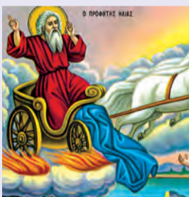
Ἡλιοῦ προφήτου τοῦ Θεσβίτου ἢ πυρφόρος εἰς οὐρανούς ἀνάβασις