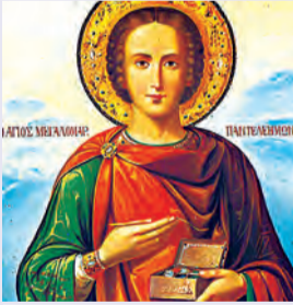
Παντελεήμονος μεγαλομάρτυρος Ἀνθοῦσης μάρτυρος