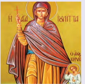
Κηρῶ & Ἰουλίττης μαρτύρων Βλαδμήρου Ἰσαποστόλου