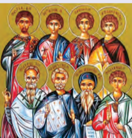
Τῶν ἐν Νικοπόλει 45 μαρτύρων Ἀντωνίου ὁσίου τοῦ Ρώσου