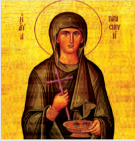
Παρασκευῆς ὁσιομάρτυρος Ἐρμολάου ἱερομάρτυρος