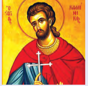
Καλλινίκου & Θεοδότῃ μαρτ. Βασιλίσκου μάρτυρος