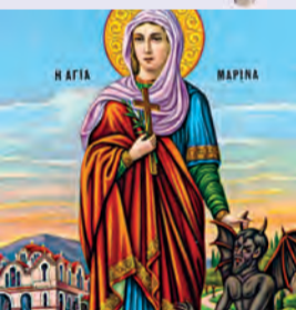
Μαρίνης μεγαλομάρτυρος Βηρονίκης & Σπεράτου τῶν μαρτύρων