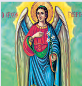
Σύναξις Ἀρχαγγέλου Γαβριὴλ Στεφάνου ὁσίου