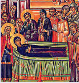
Κοίμισις Ἁγίας Ἄννης Θεοπρομήτορος