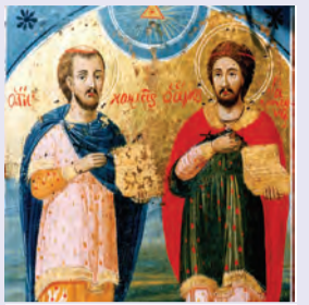
Κοσμά & Δαμιανού τῶν θαυματουργῶν Ἀναργύρων, Κων/νου & σὺν αὐτῷ μαρτύρων