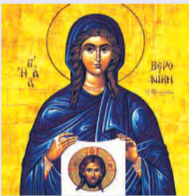
Πρόκλου & Ἰαρίου μαρτύρων Βερονίκης αἱμορροῦσης μαρτ.