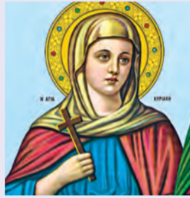
Θωμά ὁσίου τοῦ ἐν Μαλεῷ Κυριακῆς μεγαλομάρτυρος