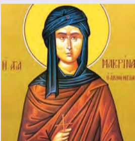
Μακρίνης & Δίου ὁσίων Ἀνακομιδῆ λειψάνων ὁσίου Σεραφεῖμ ἐν Σαρῶφ