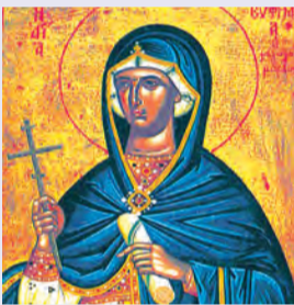
Εὐφημίας μεγαλομάρτυρος Ὀλγας Ἰσαποστ., Λέοντος ὁσίου, Μαρκιανοῦ μάρτυρος