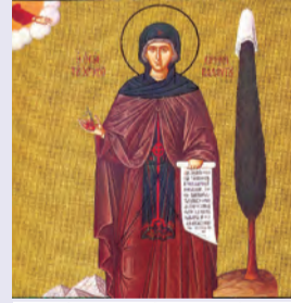
Προχόρου, Νικάνορος, Τιμῶνος, Παρμενά Ἀποστόλων ἐκ τῶν 70, Εἰρήνης Χρυσοβαλάντου