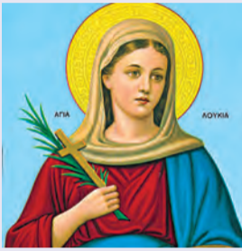
Ἀνδρέου Κρήτης Κυπρίλλης & Λουκίας μαρτύρων Θεοφίλου ἱερομάρτυρος