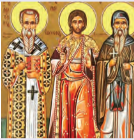
Ἀνατολίου Κων/πόλεως Ἰακίνθου & Θεοδότου μαρτύρων Γερασίου ὁσίου