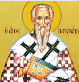
Παγκρατίου Ταυρομενίας ἱερομ. Ἀνδρέου & Πρόβου μαρτύρων Διονυσίου ὁσίου