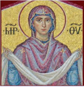
Κατάθεσις Τιμίας Ἐσθήτος Θεοτόκου ἐν Βλαχέρναις