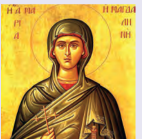
Μαρίας Μαγδαλίνης Ἰσαποστόλου Μαρκέλλης παρθενομάρτυρος