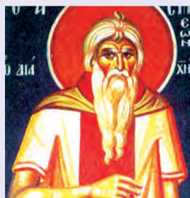
Συμεῶν ὁσίου Ἰωάννου ὁσίου Παρθενίου ἐπισκόπου Ἄρτης