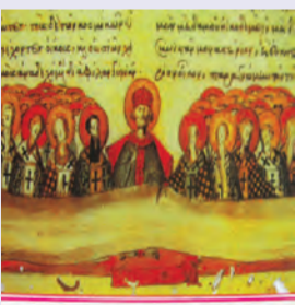
Δ' Οἰκουμενικῆς Συνόδου Ἀθηνογένους ἱερομάρτυρος Φαύστου & Ἁγίων Γυναικῶν μαρτ.