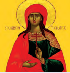
Χριστίνης μεγαλομάρτυρος Ἀθανασίου μάρτυρος