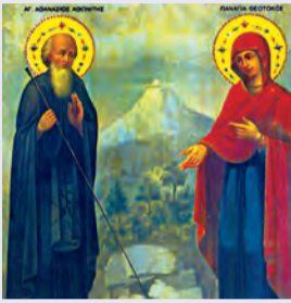
Ἀθανασίου ὁσίου τοῦ Ἀθωνίτου Λαμπαδοῦ ὁσίου τοῦ θαυματουργοῦ