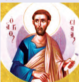
Σίλα, Σιλουανῶ, Κρήσκεντος κ.λπ. Ἀποστόλων ἐκ τῶν 70