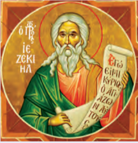
Ἰεζεκιὴλ προφήτου Φωκά ἱερομάρτυρος Πελαγίας ὁσίας ἐν Τήνῳ