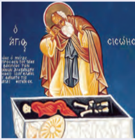
Σισώη ὁσίου τοῦ Μεγάλου Ἀργίππου, Φιλήμονος κ.λπ. μαρτ. Λουκίας & Ρήξου μαρτύρων