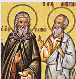
Αἰμιλιανοῦ μάρτυρος Παύλου & Παμφύ τῶν ὁσίων