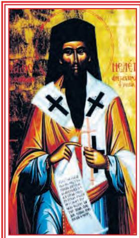
Μελέτιος Πηγᾶς Πατροῦχος Ἀλεξανδρείας 1590-1601 (εἰκὼν Μονῆς Ἀγκα- θαίου Κρήτης ὅπου εἶχε μονάσει)

Ἡ αὕτη φρικτή Ἀπόφασις κατά τῆς ἀλλαγῆς τοῦ ἡμερολογίου ὑπεγράφη ὑπό τοιοῦτου ἀναστήματος Ἐκκλησιαστικῶν ἀνδρῶν ὡς ἦτο ὁ Κωνσταντινουπόλεως Ἱερεμίας Β' ὁ Τρανός (1572-1595), ὁ Ἀλεξανδρείας Σίλβεστρος (1566-1590), ὁ Ἱεροσολύμων Σωφρόνιος Δ' (1579-1608), καί ἀργότερον ὁ ἄλλος Ἀλεξανδρείας καί ἐπί διετίαν Ἐπιτηρητής τοῦ Θρόνου τῆς Κωνσταντινουπόλεως, Μελέτιος ὁ Πηγᾶς (1590-1601).