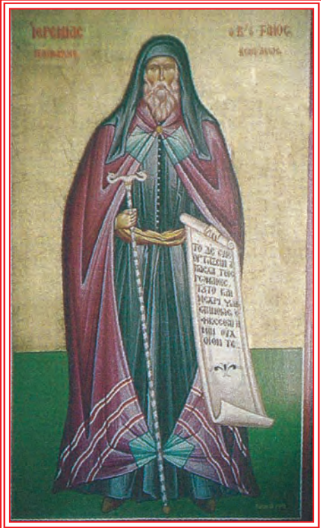
Ἱερεμίας Β΄ ὁ Τρανός Πατριάρχης Κωνσταντινουπόλεως εἰς τρεῖς περιόδους: 1572-1579, 1580-1584, 1587-1595. Ἐπὶ τῆς Πατριαρχείας του Κατεδικάσθη καί Ἀναθεματίσθη ἡ Ἀλλαγὴ τοῦ Ἡμερολογίου διὰ ΤΡΙΩΝ Πανορθόδοξων Συνόδων (φορητὴ εἰκὼν, ἔργον τοῦ 1983)

Δέν δύναται οὐδεμία ἄλλη Πανορθόδοξος ἢ Οἰκουμενικὴ Σύνοδος εἰς τὸ μέλλον νά τροποποιήσῃ, ἀλλάξῃ ἢ ἀλλοιώσῃ μίαν προηγουμένην, πόσον μᾶλλον νά ἀντιστρέψῃ ἢ ἀκυρώσῃ ἢ ἀθετήσῃ αὐτήν, διότι ἐν τοιαύτῃ περιπτώσει θά ἀντιφέρετο εἰς αὐτὸ τοῦτο τό Πανάγιον Πνεῦμα τό λαλήσαν διὰ τῆς ἐν λόγῳ Συνόδου.