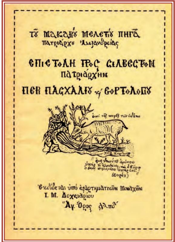
Ἐπιστολή Μελετίου Πηγᾶ, τοῦ κατόπιν Πατριάρχου Ἀλεξανδρείας, πρὸς τὸν Γέροντά του Ἀλεξανδρείας Σίλβεστρον κατὰ τοῦ Νεωτερισμοῦ τοῦ Νέου Παπικοῦ Καλενδαρίου, 10 Ἀπριλίου 1587

Πᾶσα Ἀπόφασις Οἰκουμενικῆς ἢ Πανορθοδόξου Συνόδου εἶναι Ὅριστική, Ἀμετάκλητος, Τελεσίδικος καὶ Δεσμευτική διὰ τοὺς Πιστοὺς. Τά μέλη τῆς Ἐκκλησίας τοῦ ΘΕΟΥ εἶναι ὑποχρεωμένα νά ὑπακούουν καὶ πειθαρχοῦν εἰς αὐτήν. Εἰς ἐναντίαν περίπτωσιν, οἱ ἀπειθοῦντες καὶ μὴ πειθαρχοῦντες ὑπόκεινται εἰς