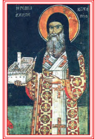
Ἱερεμίας Β' ὁ Τρανός Πατριάρχης Κων- σταντινουπόλεως (εἰκὼν ἐκ τοιχογραφίας εἰς Μονὴν Ἁγίου Ὄρους)

Αἱ Ἀποφάσεις αὐταὶ τῶν Πανορθόδοξων Συνόδων εἶναι ΟΡΙΣΤΙΚΑΙ, ΑΜΕΤΑΚΛΗΤΟΙ, ΤΕΛΕΣΙΔΙΚΟΙ ΚΑΙ ΚΑΤΑΔΙΚΑΣΤΙΚΑΙ ΔΙ' ΟΛΟΥΣ ΤΟΥΣ ΠΑΡΑΒΑΤΑΣ . Δέν δύναται οὐδεμίᾳ ἄλλῃ μελλοντικῇ Σύνοδος νά τροποποιήσῃ ἢ ἀλλοιώσῃ αὐτάς. Καί οἱ παραβαίνοντες αὐτάς δέν εἶναι ὑπόδικοι εἰς μελλοντικὴν Σύνοδον· εἶναι ἤδη Προδεδικασμένοι καί Καταδεδικασμένοι.