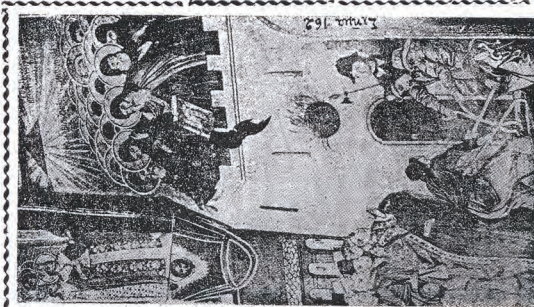
Οι έν. Μη Μορθ τῶν Ζωγράφου 28. Ὁσεκομόφρες, ὅταν ἐξέλθουν εἰς τὸν Παρθὸν τῆς Μορθ διὰ τὸν δὲν ἐδέχθησαν νὰ ἐπιφωνήσουν μετὰ τοῦ Λατινοφρόνου Πατριάρχου Βέγκου.