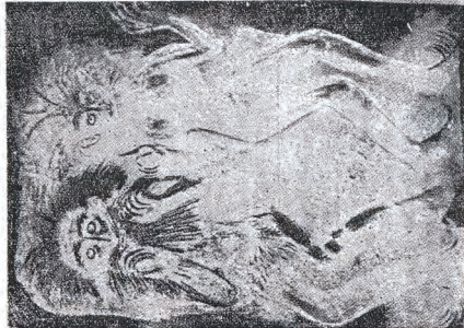
Εἰς τὴν ἀνωτέρω φωτογραφίαν, ὅταν οἱ ἀφορισμένοι Λατῖνοι καὶ ἁγ. Μορθ τῆς Μονῆς ἐν τῶν ἁγ. Λαύρας, καὶ ἐπειθὴ ἐδέχθησαν νὰ ἐπιφωνήσουν μετὰ τοῦ Λατινόφρονος Πατριάρχου Βέγκου, ἔκαψαν καὶ παρμένοντες εἰς τὴν ἐκκλησίαν εὐλογία Πατρὸς τῆν ἑλαβον διὰ τὸν Λατινοφρόνον.

Ἔτος 1277—Ἰηρεῖς, ἀφορισμένοι, ἀλυτοὶ, τῆς Λαύρας ἁγ. Ὁρους!