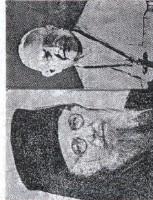
Ὁ ἁγιώτης τῶν αἰρετικῶν Καθολικῶν Πάπας Ἰωάννης Ε΄, καὶ ὁ ἁγίωτος τῆς Κέντηρος 32 Πατριάρχης Νικόλαος Κατανακτῆς, ὅταν ἐξέλθουν εἰς τὴν ἐκκλησίαν εὐλογία Πατρὸς τῆν ἑλαβον διὰ τὸν Λατινοφρόνον.

Δημοσίευμα τοῦ Ἀρχμ. Καλλιόπου Γιαννακουλοπούλου εἰς τὸ περιοδικόν του «Ὁρθόδοξος Παρατηρητής». Ἰούλιος - Αὐγουστος 1962, σελ. 4-5. Εἰς αὐτό ἐξομοιώνει τὸν Ἀκάκιον Παππᾶν μετὰ τοὺς Ἀφορισμένους καὶ Ἄλυτους τῆς Λαύρας τοῦ Ἁγίου Ὁρους καὶ μετὰ τοὺς Λατινόφρονες τοῦ Πατριάρχου Βέγκου, οἱ ὁποῖοι ἔκαψαν τοὺς 26 Ὁσιομάρ-