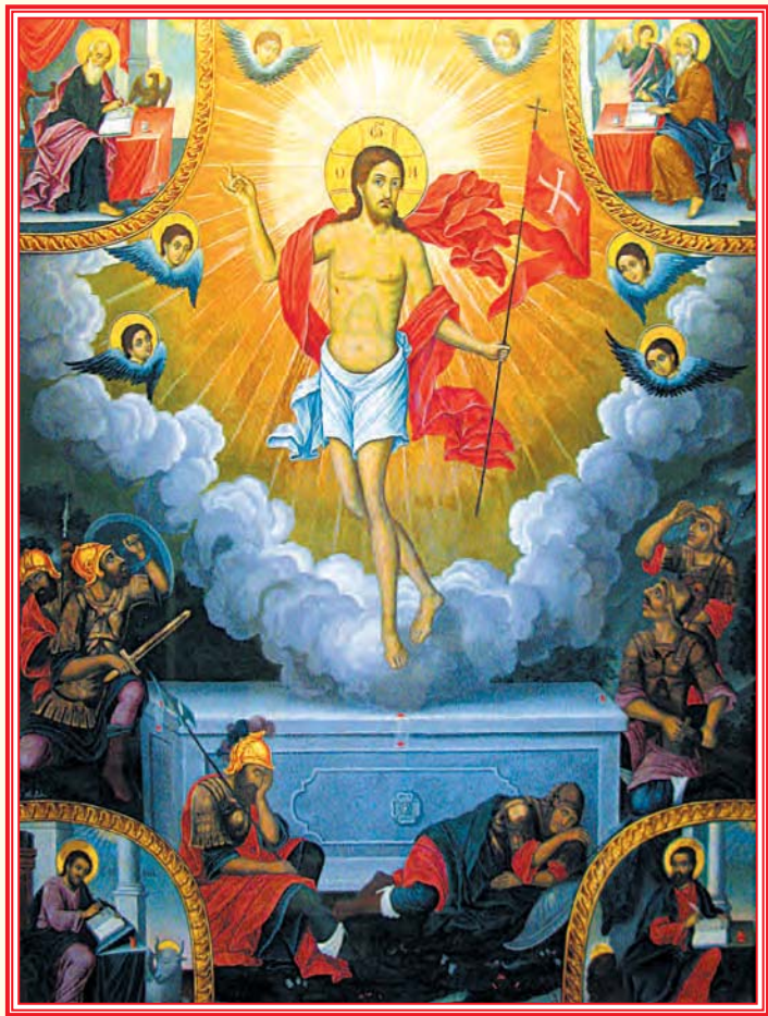
Ἡ ἐκ τάφου ἔνδοξος Ἀνάστασις τοῦ Κυρίου καὶ Θεοῦ καὶ Σωτῆρος ἡμῶν Ἰησοῦ Χριστοῦ. Λάβαρον, Μονὴ Ἁγίου Ἰωάννου τῆς Ρίλας, Βουλγαρία.